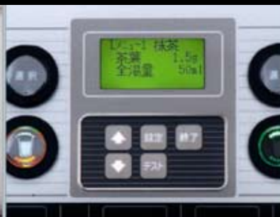
28 verschiedene Teevarianten sind einstellbar z.B. Matcha Tee, Matcha au lait, Matcha latte, Kräutertee, Chinesischer Tee, Schwarztee mit aufgeschäumter Milch, etc.