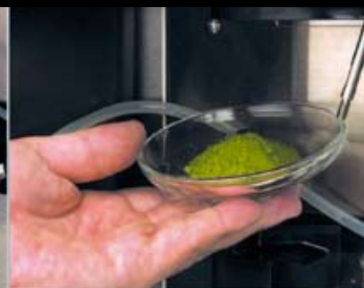
separate Entnahme des feinstgemahlten Pulvers möglich, z.B. für die Verfeinerung von Desserts oder als Topping