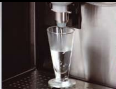
2 getrennte Wassertanks für unterschiedlich temperiertes Heißwasser für original Matcha oder andere Teespezialitäten, auch nur Heißwasserentnahme möglich