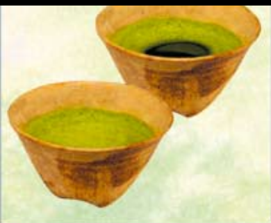
Der Schaumaufschlag kann eingestellt werden analog den Zubereitungsarten der japanischen Teezeremonie im „Omote-senke Stil“ oder im „Ura-senke Stil“