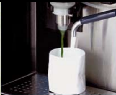
Matcha latte ist eine der beliebtesten Varianten und innerhalb von 20 Sekunden zubereitet durch einen in der Maschine eingebauten Milchaufschäumer