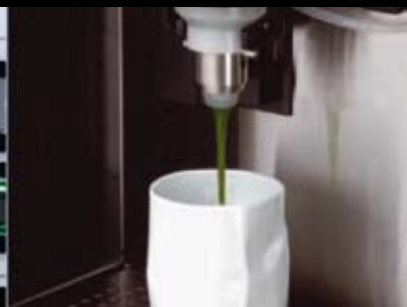
1,4 g Matcha reichen aus für eine Tasse Teelerlebnis