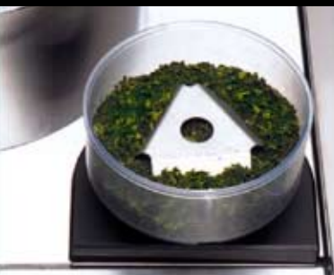
hochwertigste Tencha Blätter werden in einem keramischen Mahlwerk feinst vermahlen

Matcha ist absolut im Trend. Immer mehr Menschen schätzen den exquisiten Geschmack sowohl als Heißgetränk pur oder mit Milch oder Sahne, aber auch geistig oder als kühles Mischgetränk mit Fruchtsäften oder zur Verfeinerung von Desserts oder als Topping.