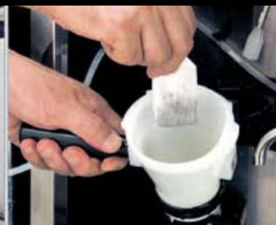
Durch Entnahme des Aufschäumers ist es problemlos möglich auch Teebeutelvarianten zuzubereiten